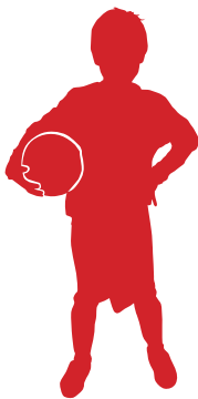
Energía potencial = sostener una pelota (o una pelota en el suelo)