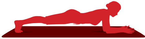
Energía potencial = posición de plancha

Intenta este juego con diferentes movimientos. Combínalos todos en una pista de obstáculos.