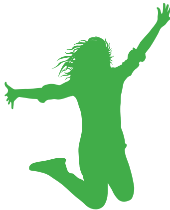
Energía cinética = brincar