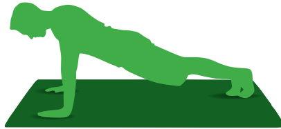
Energía cinética = hacer una flexión de brazos