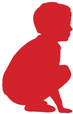
Energía potencial = agacharse