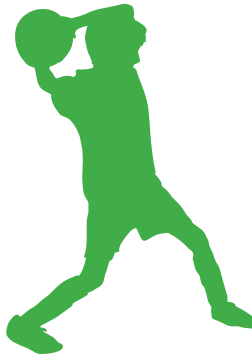
Energía cinética = lanzar una pelota (o patear una pelota)